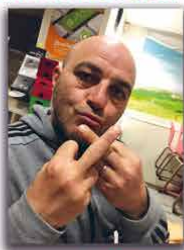
LA PHOTO DU JOUR

NOUS ! AVONS ENCORE PASSÉ UNE SOIRÉE TRÈS CHAUDE AU "PETIT PÂTÉ CLUB" DE PÉZENAS HIER SOIR !